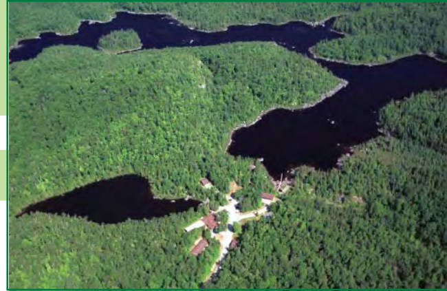
Un lieu incitant à la réflexion et à la rédaction en plein coeur de la nature