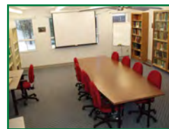
Salle de rencontre