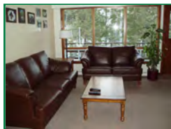
Salon avec foyer