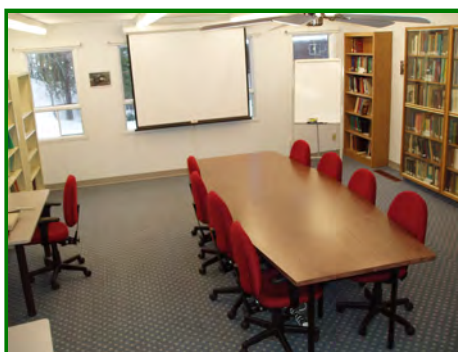
Salle de réunion (Jusqu'à 18 personnes)