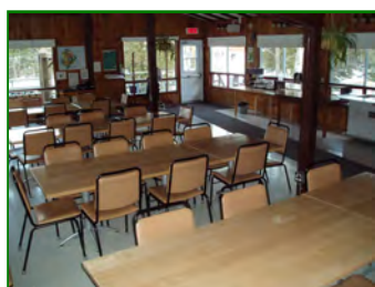
Salle à manger et salle de rencontre (40 personnes)